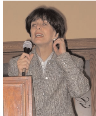
Visite de la Ministre lors de la Rencontre nationale au Mont-Gabriel l'an dernier